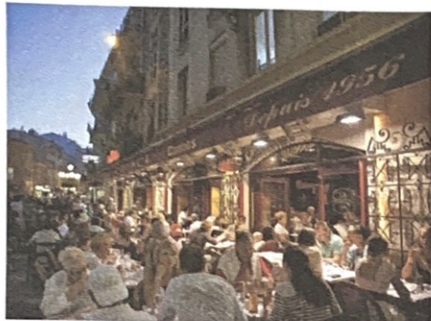
Un restaurant dans le Vieux Nice

EXEMPLE le samedi matin: passer la matinée à la maison Le samedi matin, je passe toujours (souvent...) la matinée à la maison. Je ne passe jamais la matinée à la maison.