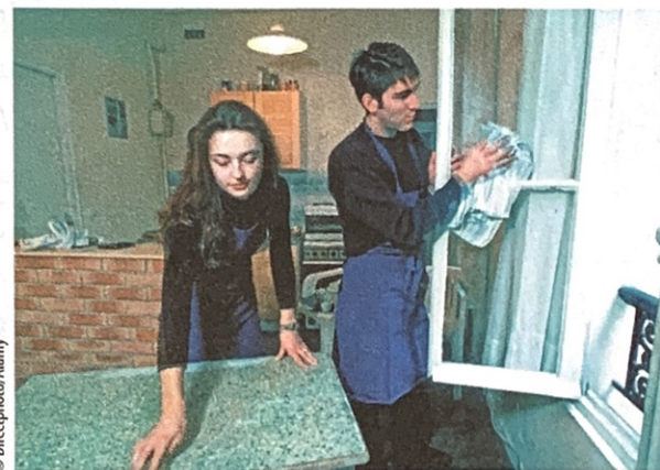
Comment est le/la colocataire idéal(e)?