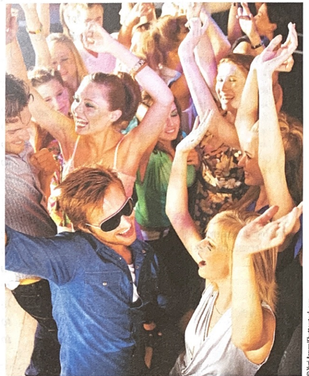
Vous dansez bien?