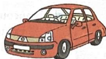
en voiture ( f )