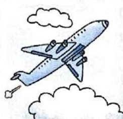
en avion ( m )