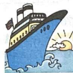
en bateau ( m )