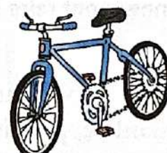
à vélo ( m )