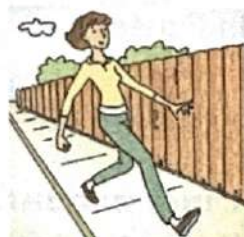
à pied ( m )