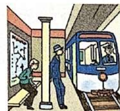
en métro ( m )