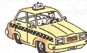
en taxi ( m )