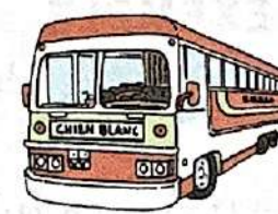
en car / en autocar ( m )

Il y a d'autres possibilités pour aller en ville. Comment venez-vous en cours?