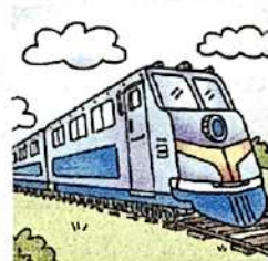
en train ( m )