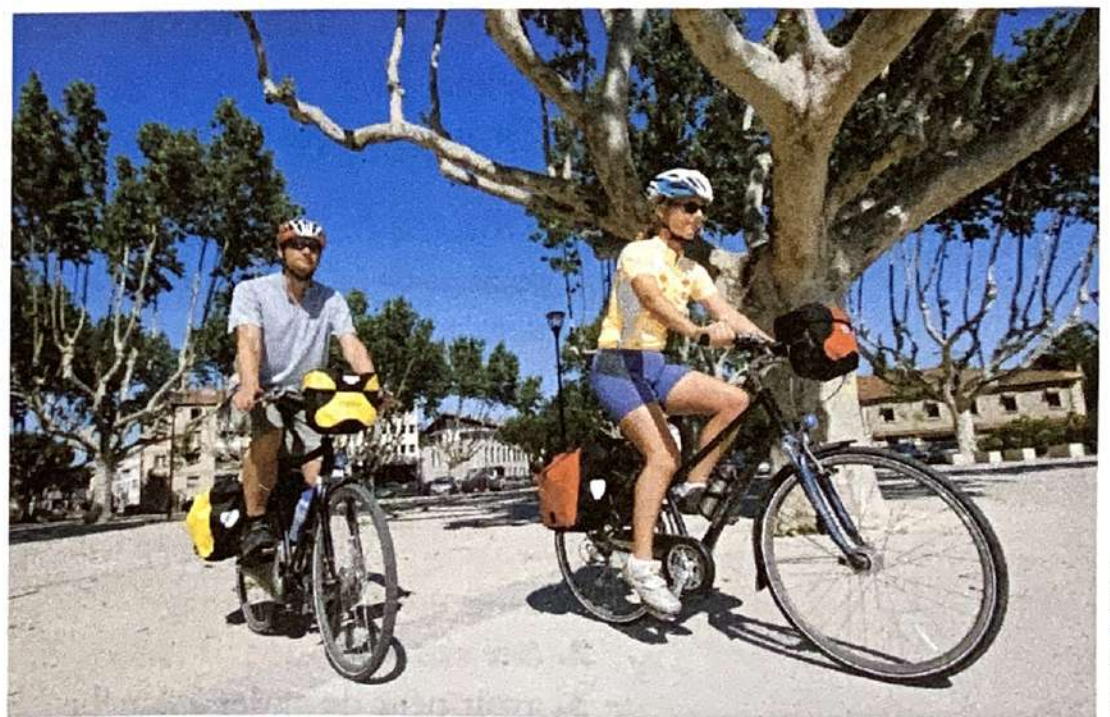
Prenons les vélos!