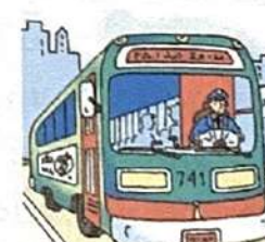
en bus / en autobus ( m )