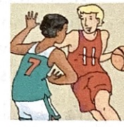
les matchs de basket de l'université